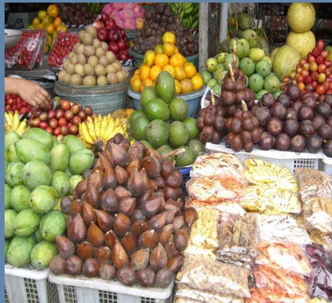
Bild mitte links, Elefantengrotte Goa Gajah. Bild mitte rechts, Obst auf einem Markt. Bild unten links, Reisbauer bei der Arbeit Bild unten rechts, Blick auf den See Danau Beratan von einer Kaffeeplantage aus.