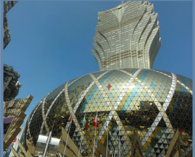
Bilder oben, das Grand Lisboa Casino Macau.