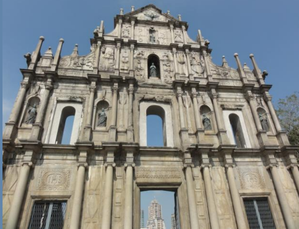
Linkes Bild die Ruinen von St. Paul's. Unten der Aufgang zur Festung Monte Fort. Die Festung wurde gebaut 1617-1626.